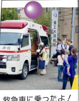
救急車に乗ったよ!