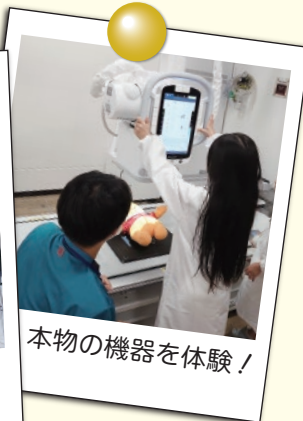
本物の機器を体験!

2025年10月18日(土)に「名古屋健康フェスタ」を開催しました。当日は天気もよく、600名を超える方にご来場いただきました。