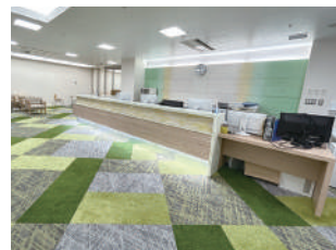
健診センター 受付