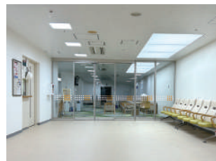
健診センター 入口