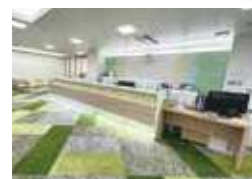
健診センター 受付