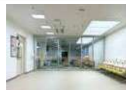
健診センター 入口