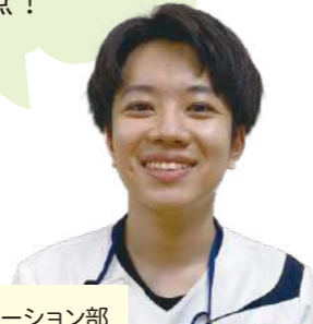
» リハビリテーション部