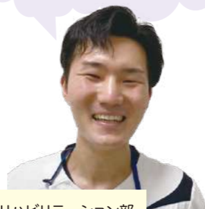
» リハビリテーション部