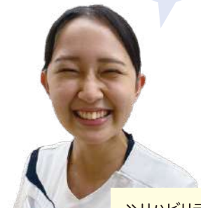
» リハビリテーション部